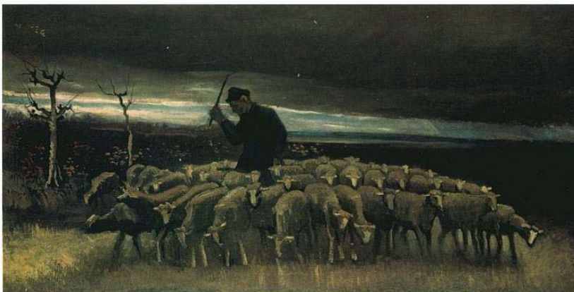
Vincent van Gogh: Schaapherder met kudde, Nuenen september 1884