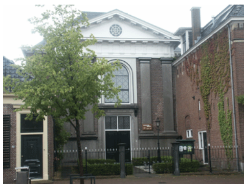
Kerkgebouw Doopsgezinde Gemeente Sneek