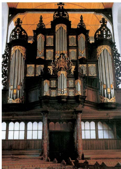
Arp Schnitger orgel Martinkerk